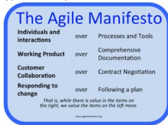
GAMBAR 2: Manifesto Agile

Banyak hal yang dapat digunakan sebagai metode penelitian mengenai bidang pendidikan, akan tetapi sesuai dengan perkembangan yang ada saat ini maka diadopsilah sebuah teknologi mutakhir yang dipercaya dapat membantu meringankan permasalahan bidang pendidikan sebagai berikut: